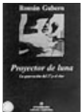
Portada del libro. Proyector de luna